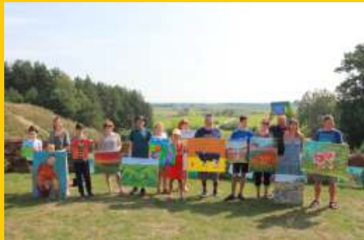
14-19.08.2017. Ogólnopolski plener malarski w Szostakach „Kultura łomżyńska pędzlem malowana.”