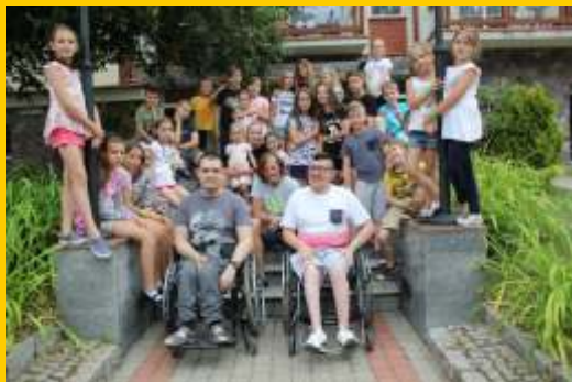
05-11.08.2017. Warsztaty Zespołu Pieśni i Tańca „Łomża”.