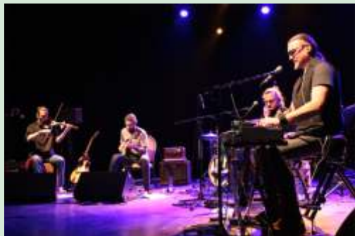
15 lutego 2017. Koncert Macieja Balcara.