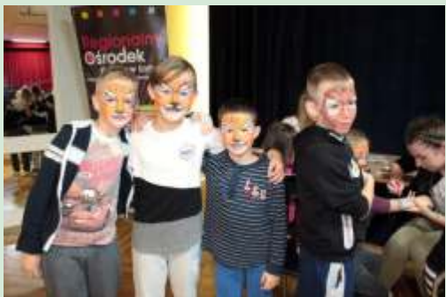
01.06.2017. Dzień dziecka z Linguo w ROK Łomża.