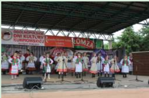
17.06.2017. XXIV Ogólnopolskie Dni Kultury Kurpiowskiej w Nowogrodzie.