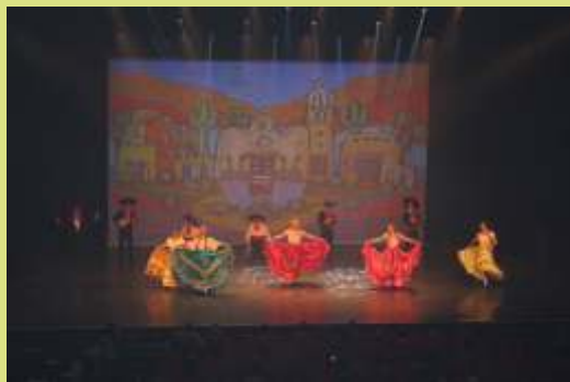
24-29.11.2017. Finał festiwalu Mode H w Tours we Francji. Grupa taneczna „Tacy sami”.