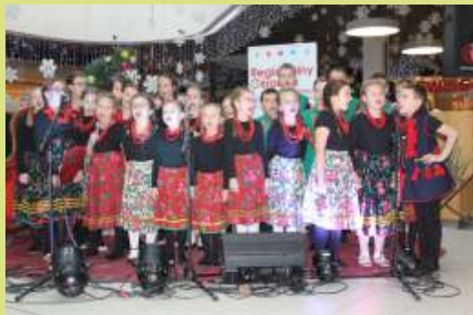
17.12.2018. Świąteczne kolędowanie z galerią Veneda.