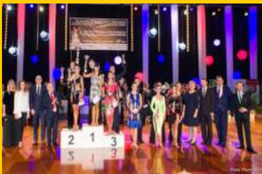
22.10.2017. XXI Ogólnopolski Turniej Tańca Towarzyskiego o „Puchar Marszałka Województwa Podlaskiego, Starosty Łomżyńskiego i Prezydenta Miasta Łomża”.