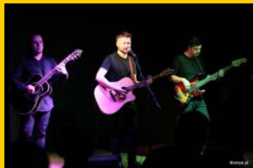
12.10.2017. Najpiękniejsze pieśni i ballady Bułata Okudźawy - koncert muzyków zespołu PIRAMIDY.