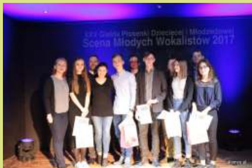
01.12.2017. XXV Scena Młodych Wokalistów Giełda Piosenki Dziecięcej im. M. Żemka.