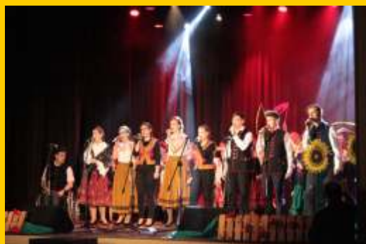
10.11.2017. Tryptyk Polski - koncert upamiętniający 99. rocznicę odzyskania przez Polskę niepodległości.