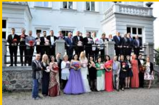
30.06-09.07.2017. XXIV Festiwal Muzyczne Dni Drozdowo-Łomża 2017.