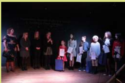
10.12.2017. Festiwal Piosenki Świątecznej „Gwiazdkowe Nutki”.