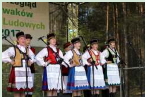
14.05.2017. Regionalny Przegląd Kapel Śpiewaków i Gawędziarzy Ludowych - Zbójna.