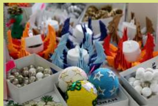
10.12.2017. Mikołajkowe Targi Twórczości Artystycznej